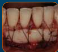
CONFÉRENCES CAS CLINIQUES