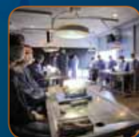
DISSECTIONS (LABORATOIRE D'ANATOMIE)